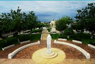
ESTAMPADO PARQUE DE SAN FRANCISCO