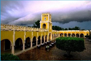
ESTAMPADO PLAZUELA DE SAN FRANCISCO