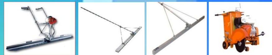
REGLA MAGIC SCREED