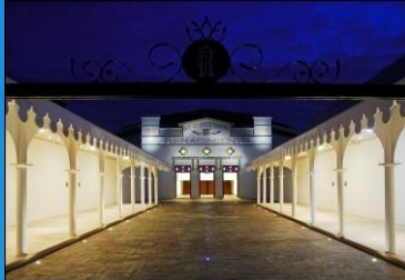
ESTAMPADO CIRCO TEATRO RENACIMIENTO